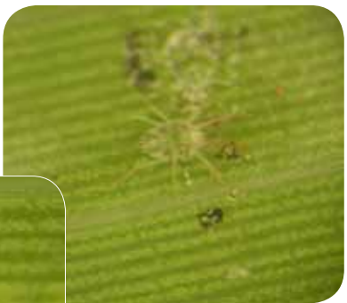
↑図2 歩行中のイトマキハダニのメス

「イトマキハダニ」は扁平な体をもちます(図2)。この平べったい体を葉面に密着させることで捕食者から身を隠す、忍者のようなダニです(図3)。ハダニ類や