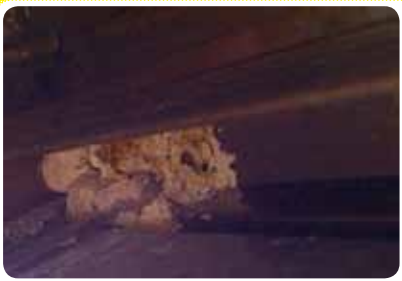
写真2 ドロバチの仲間の巣

などは、このように土の中に営巣することが知られるため、山道などを歩く際はうっかり踏み付けないうような注意が必要です。