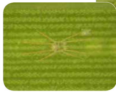
↓図3 隠れ身の術中のイトマキハダニのオス

天敵であるカブリダニ類は、画像を結べるような立派な眼をもちあわせておらず、私たちよりもはるかに嗅覚や触覚に依存して暮らしています。そのため、扁平な体をもつイトマキハダニが葉面に張り付いていると、カブリダニ類は餌探索中であつても、気付かずその上を通り過ぎてしまいます。隠れ身の術?といったところでしょうか。しかし、動くことのできない卵はどうやって捕食回避をしているのでしょうか? 産卵直後のイトマキハダニの卵は、他のダニと同様に球形をしています。ところが、メスは産卵直後に壊れないように気をつけながら卵をゆつくりゆつくりと押しつぶして平たくし、糸でもって葉面に固定します。そのため、卵も平べったい形状となり、隠れ身の術が使えるのです。このダニについては、当センター内のササ群集で探してみましたものの、残念ながらまだ見つかっていません。