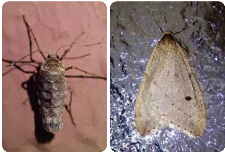
フユシヤクのメス（左）とオス（右）

冬の昆虫の代表は、なんとと言ってもフユシヤク（蛾の仲間）でしょう。夜、部屋の灯りに地味な灰色の蛾（写真右）が来ているのを