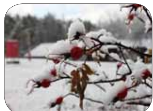
カラフトイバラの実