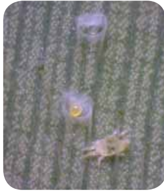
図1 ヒメササマタハダニとテント型のシェルター

簡易なシェルターと言えば、テントを思い浮かべる人が多いと思います。登山やキャンプ、野外フェスティバル、災害時など、様々な場面でテントが活躍しますが、ハダニにも、糸(前号でお話しした通り、ハダニはクモの様に糸を吐くことができます)、命綱やシェルターに使っています)を使ってテント状の小さなシェルターをつくるものがあります。それが、「ヒメササマタハダニ」です(図1)。ササ